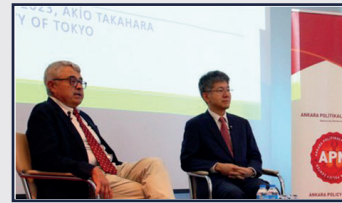
“Dünya genelinde otokrazi ve demokrasi arasında büyük bir mücadele var”