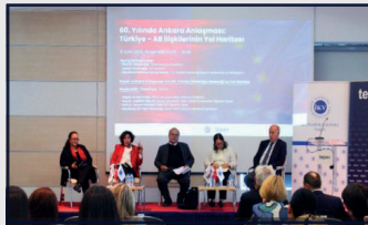
TEPAV ve İKV, Ankara Anlaşması’nın 60. yılında Türkiye-AB ilişkilerini mercek altına aldı