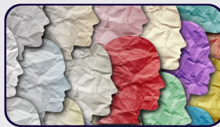
Demografik geçiş ekseninde gelecekte bizi neler bekliyor?