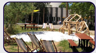
Kent içinde kalan askeri alanlar nasıl değerlendirilebilir?