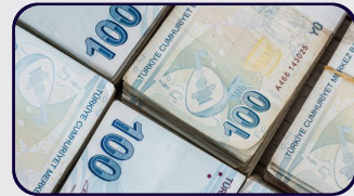
"İkinci nesil reform çalışmaları ivedilikle başlatılmalı"