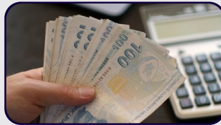
Türkiye'nin ücret sorunu: Neden asgari ücreti çok konuşuyoruz?