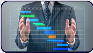
Kapsamlı bir ekonomik istikrar programına ihtiyacımız var