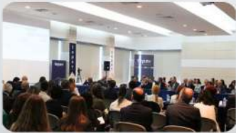
Türk ve Alman uzmanlar kömürden çıkışı tartıştı