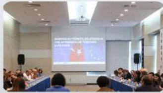
Türkiye-Avrupa Birliği ilişkileri nereye gidiyor?