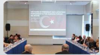
Türkiye -Arnavutluk toplantısı