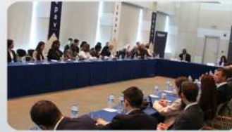
TEPAV Diplomasi Söyleşileri başladı