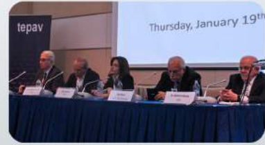
Dünden bugüne Türkiye-Amerika ilişkileri masaya yatırıldı