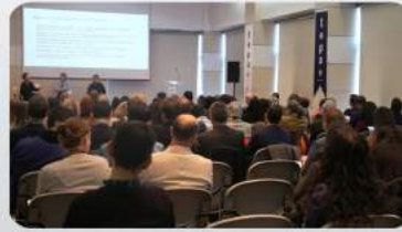
AB-Türkiye Mülteci Mutabakatı'na yeniden bakış