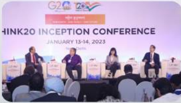
TEPAV, T20 Hindistan açılış konferansına katıldı