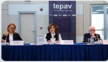
Kıbrıs: Çözüm için bir umut var mı?